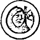
Masoumeh Ebtekar Vice President of Iran and head of DOE