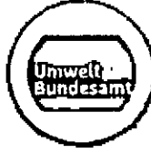
German Environment Agency (UBA)

زمان برگزاری: ۷ اسفند ماه ۱۳۹۵ Date: 25 Feb, 2017