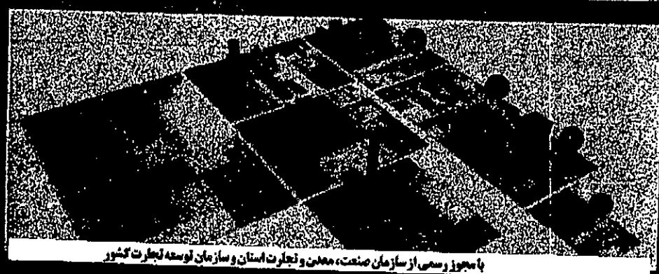
با مجوز رسمی از سازمان صنعت، معدن و تجارت استان و سازمان توسعه تجارت کشور

www.iceowao.com @ jmj_765@yahoo.com @Expriammiandoab @Expoirammiandoab2018